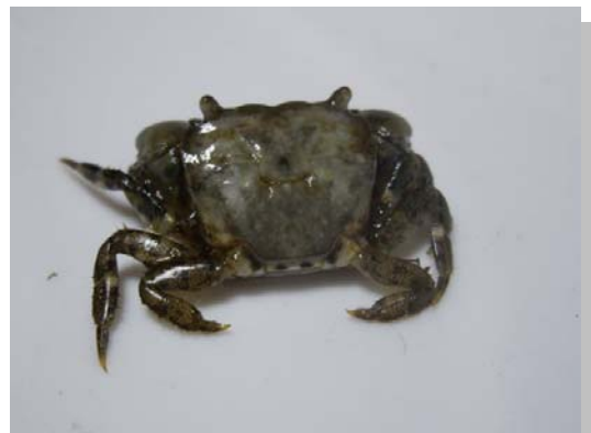
ヒライソガニの一種