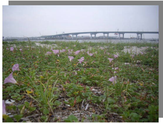
ハマヒルガオの群落