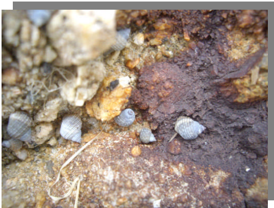
アラレタマキビガイ