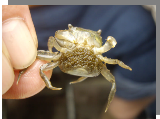
タカノケフサイソガニの抱卵