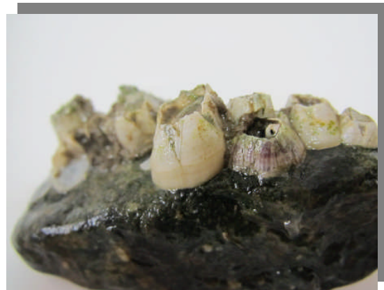
ヨーロッパフジツボ、タテジマフジツボ