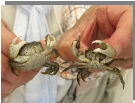
ケフサイソガニ(左)、タカノケフサイソガニ(右)