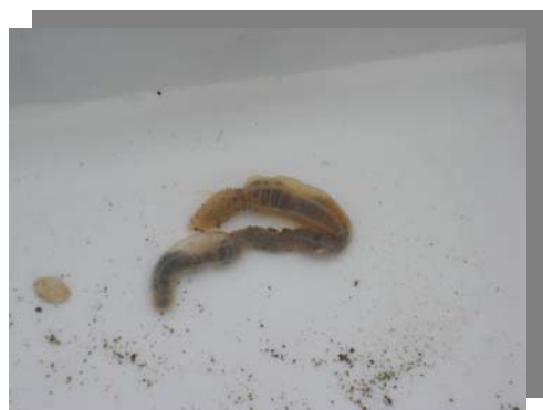
ヒモイカリナマコ、 ヒモイカリナマコツマミガイ