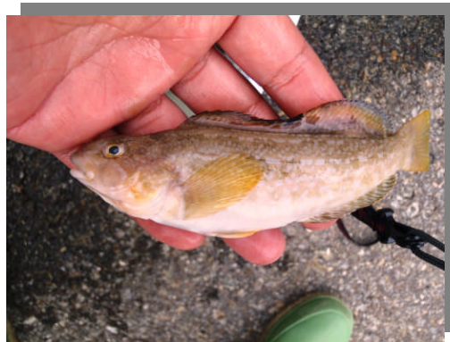
観察された生き物