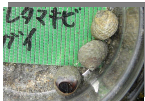
アラレタマキビガイ