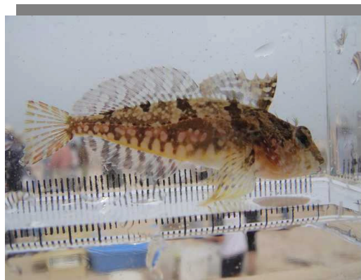
地曳網でみつかった生き物