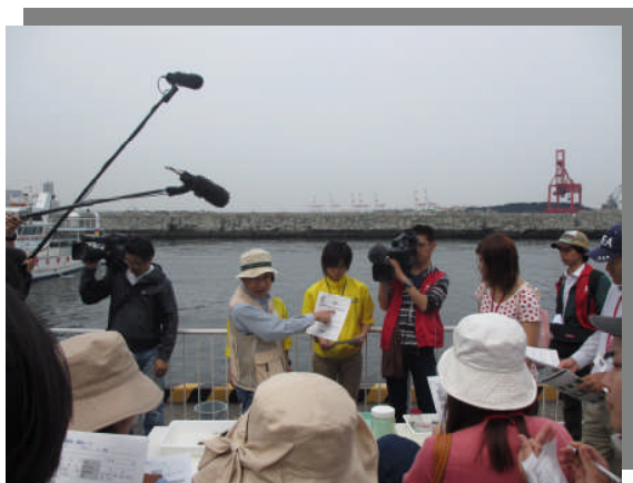
調査についての説明