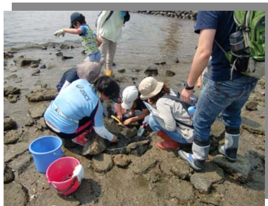
子どもたち熱心に