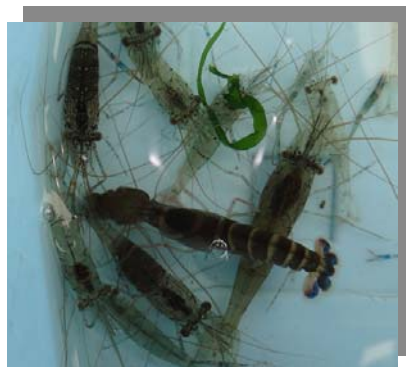
観察された生き物