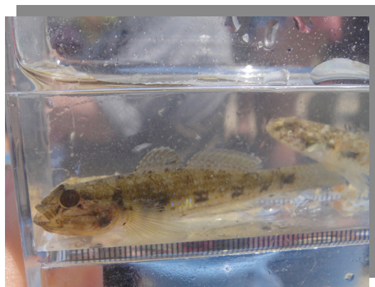
観察された生き物