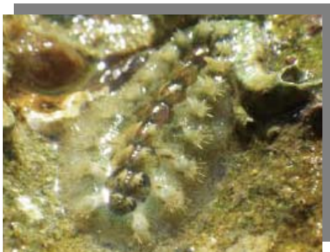
ヒメケハダヒザラガイ