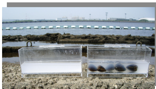
アサリの浄化実験