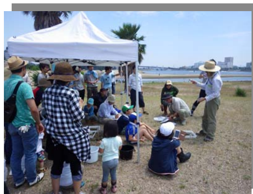
生き物の解説の様子