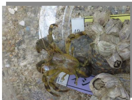
ユビナガホンヤドカリ