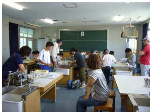
生物の同定の様子