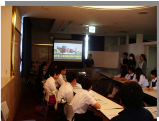
オリエンテーションの様子