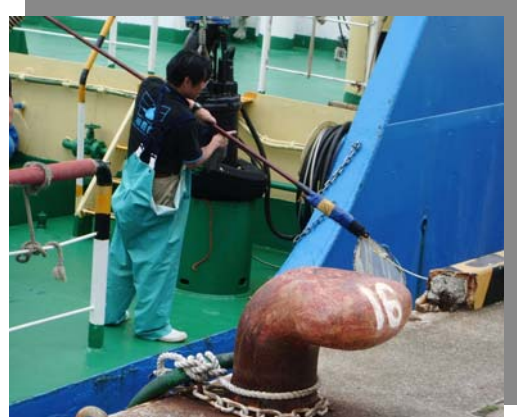
直立護岸付着物の剥ぎ取り