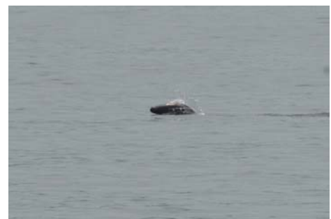
水面上に体を大きくあらわしたスナメリ