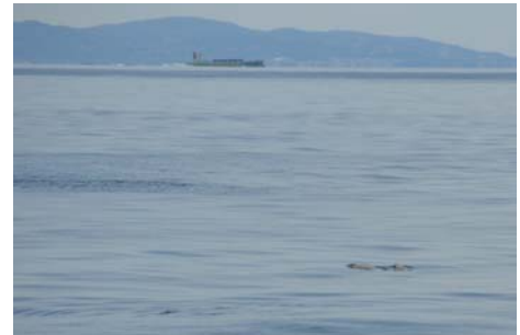
なぶらとスナメリ