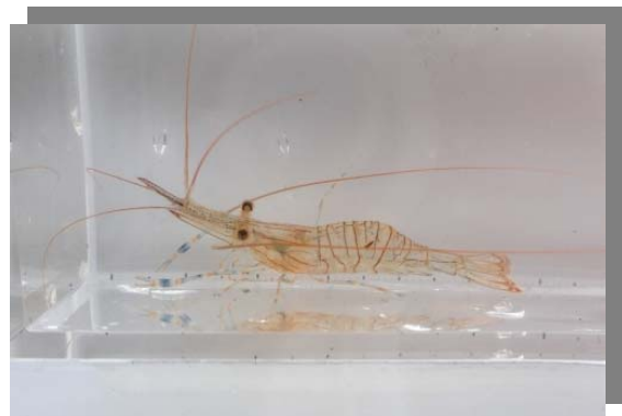
アシナガスジエビ