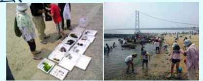
昨年の生き物一斉調査の様子